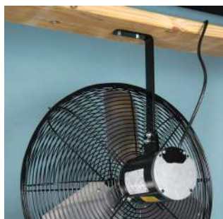
Ventilador recirculador de 20 pulgadas (508 mm) de diámetro, con soporte para montaje de techo.