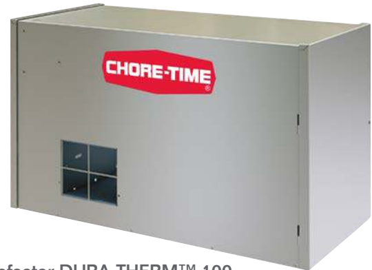
Calefactor DURA-THERM™ 100