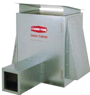
Juego de montaje para exteriores