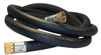
Manguera de gas