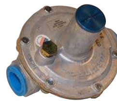
Regulador de gas