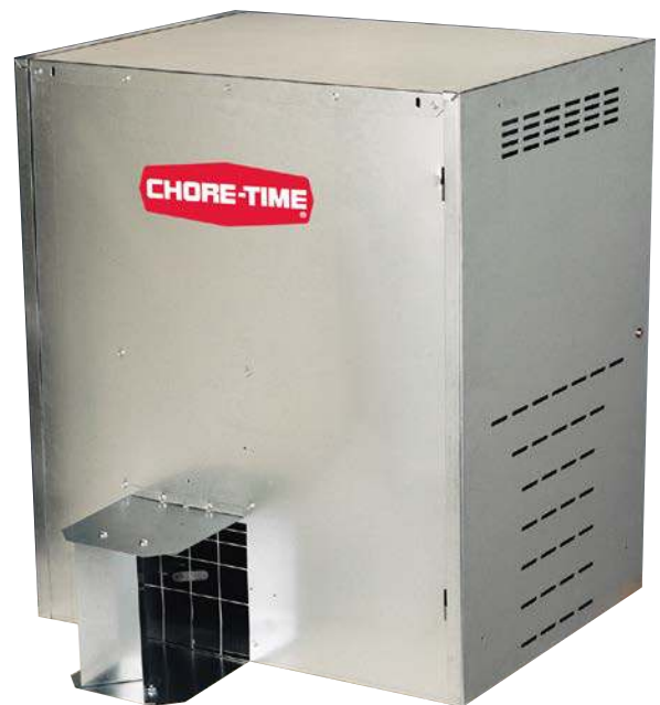
Calefactor DURA-THERM™ 250

*Los clientes pueden obtener ayuda para la diagramación de las tuberías de gas con los distribuidores autorizados.