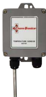
Sensor de temperatura