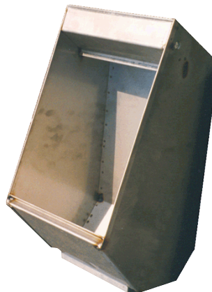
Comedero de fondo plano