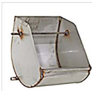
Comedero inclinable con pestillo

Los comederos de acero inoxidable para cerdas de Chore-Time están disponibles en varios diseños para acoplarse con los dosificadores de Chore-Time. Estos comederos pueden usarse también para alimentar cerdas manualmente. El diseño del comedero ayuda a evitar el desperdicio de alimento.