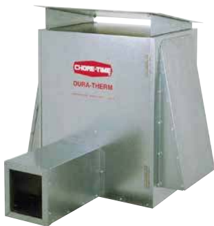
Juego de montaje para exteriores