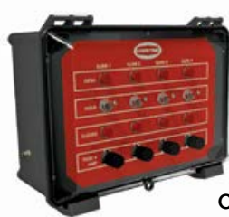
Control de corredera de bota de silo automático

> El control de corredera de la bota de silo automático de Chore-Time puede operar hasta cuatro correderas de bota de silo. > Un indicador de luz permite saber fácilmente si la corredera de la bota de silo automática está abierta o cerrada.