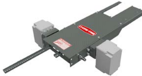
Accionador de corredera de bota doble