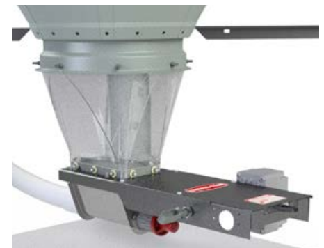
Accionador de corredera de bota sencilla